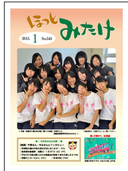
御嵩町広報紙“ほっとみたけ”